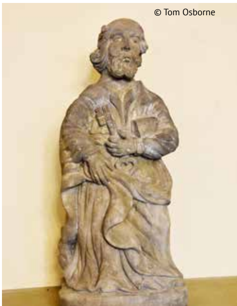
Eng al Statue vum Hl. Péitrus

krut Giischt eng nei Schoul. Well déi Zäit nach keng Goudronsstroossen tëscht den Dierfer an d'Weeër vu Giischt op d'Klaus oder op Bur bei schlechtem Wieder ganz schwierig ze goen woren, koom de Wonsch op och zu Giischt selwer am Duerf eng Plaz fir Gottesdingscht a Gebied ze kréien. 1928 ass dunn déi al Schoul als Kapell ëmfonctionnéiert ginn a krut als Schutzhellegen ee vun de Niewepatréiner vun der Klaus, den Evangelist Lukas. Deem säi Fest, den 18. Oktober, leet d'Giischer Kiermes fest.