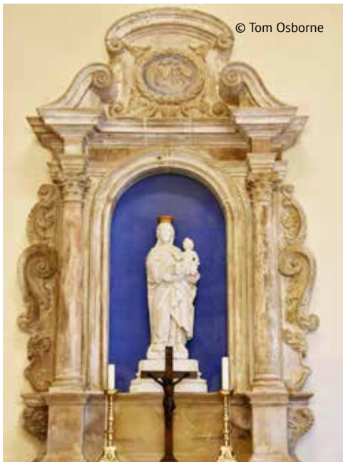
Altar vun 1725

Iwwert d'Jorhonnerte wor d'Giischerklaus d'Kapell fir d'Duerf niewendrunn. De Numm Giischerklaus heescht jo Einsiedelei vu Giischt. Déi eeler Leit nennen haut nach d'Plazen hannen am rietse Säiteschëff vun der Klaus 'd'Giischer Still.' Bis haut hunn déi Giischer Famijen hier Griewer op der Giischerklaus. Dat obschons déi al Uertschaft Giischt, fréier alt och emol