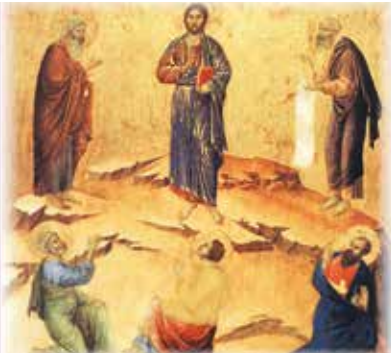
Verklärung - Duccio di Buoninsegna 1308

Petrus sagte zu Jesus: Meister, es ist gut, dass wir hier sind.