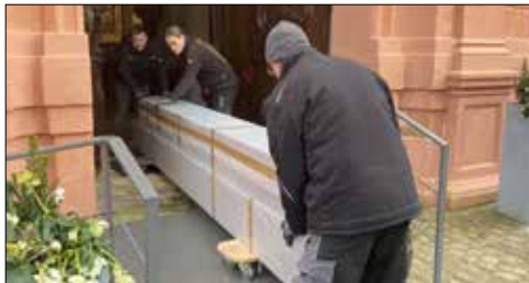
Die großen Orgelpfeifen werden angeliefert

Nach langwierigen Verhandlungen mit der Denkmalpflege erreichte uns am Fest des Hl. Martin (!), dem 11. November 2024, die Erlaubnis vom Kulturminister Eric Thill, das neue Teilwerk der Orgel hinter dem Altar errichten zu dürfen. Seit einigen Wochen ist nun die Firma Orgelbau Mayer aus Heusweiler (D) dabei, das neue Solo-Chorwerk hinter dem Hochaltar über dem vorhandenen Sakristeischrank einzubauen.