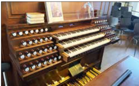
Der erweiterte Spieltisch auf der Empore

Die sechs neuen Register (mit 310 Pfeifen, die größte davon 5 Meter lang) sind zwar für den Betrachter unsichtbar, werden aber akustisch deutlich neue Akzente setzen. Angesteuert werden die Orgelpfeifen vom Spieltisch der Emporenorgel, der um ein drittes Manual ergänzt wurde. Ein Steuerungskabel, welches über Dachboden, Turm und Sakristei verläuft, ermöglicht die elektronische Anbindung.