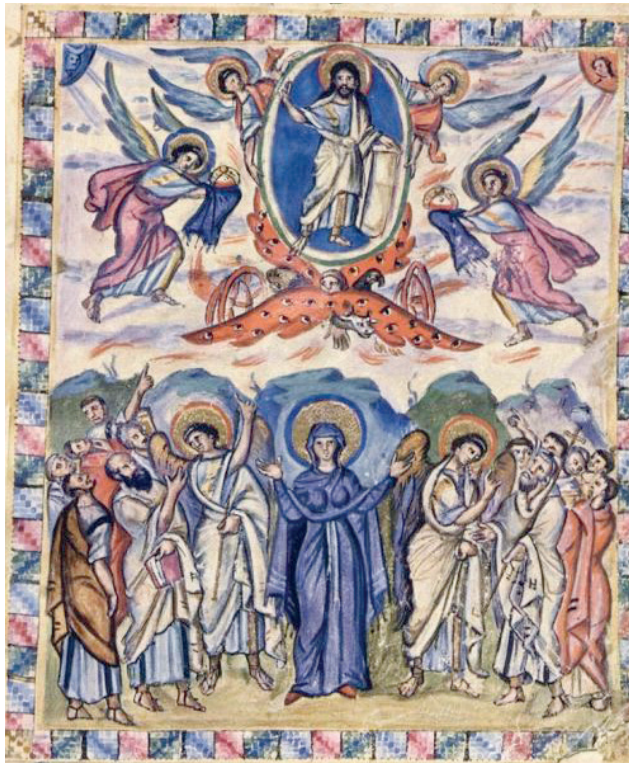
Christihimmelfahrt - Rabulaevangeliar