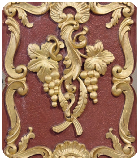
Tabernakel Braidweiler