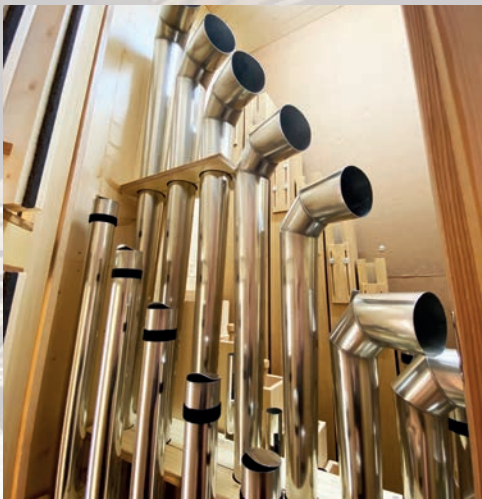
Blick ins Solo-Chorwerk, mit Clarinette und Tuba im Vordergrund.

Die einzelnen Register werden hier kurz vorgestellt: Die Philomena 8' (mit zwei Labien) ist eine raumfüllende Soloflöte,